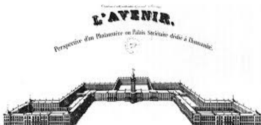
gravure de Charles Fourier représentant un Phalanstère